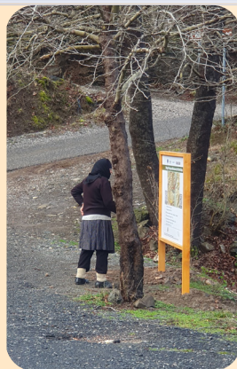
Kapitalizimi i vlerave kulturore, historike dhe natyrore të zonës së Mirditës

Këtu janë disa shembuj frymëzues në zonën e Mirditës: